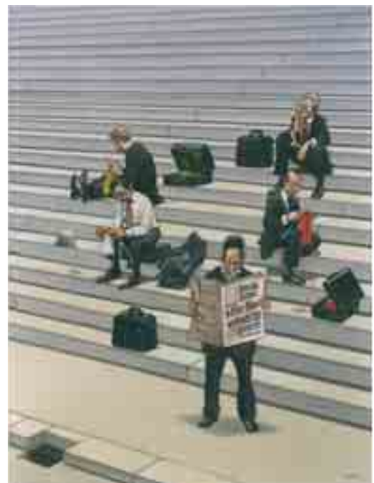
Anwälte in der Sinnkrise

Dabei sind es vor allem die vertrauten Szenen des Alltags, die der Künstler aufs Korn nimmt und der Gesellschaft dabei den Spiegel vorhält. Von Kritik über seine gezeichneten Provokationen lässt er sich nicht einschüchtern. „Respektlosigkeit ist